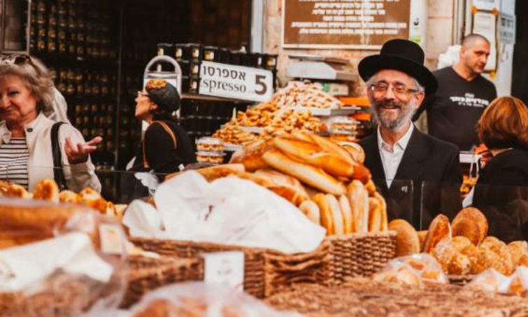
Mahane Yehuda Markt, Jerusalem

ebenfalls besuchen und die einmalige Atmosphäre an diesem Ort genießen.